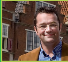
8. Harold IJskes